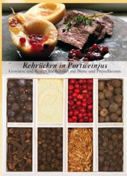
Rehrücken in Portweinjus Vermutlich eines der zartesten Wildgerichte überhaupt. Seine kurze Garzeit macht unseren Rehrücken durchaus gesellschaftsfähig.