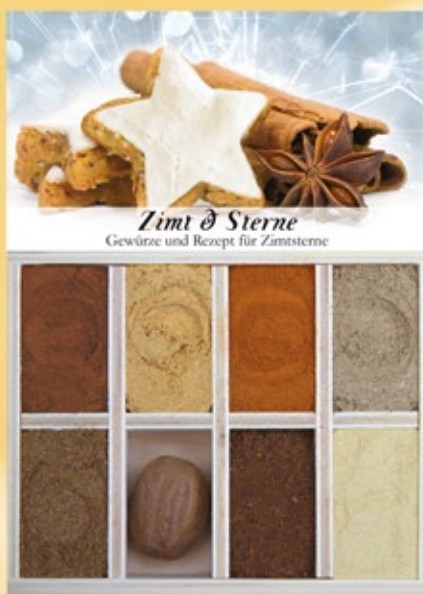
Zimt & Sterne Altes schwäbisches Bäckereihandwerk. Ein absoluter Weihnachtsklassiker, mit feinem Eischnee und vielen Mandeln.