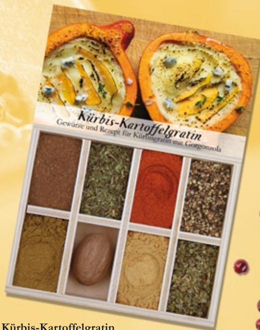
Kürbis-Kartoffelgratin Unser Kürbis-Kartoffel-Gratin muss auf jeden Fall in kleinen halben Kürbissen serviert werden. An Halloween ist das die halbe Miete!