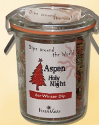
Aspen Holy Night Ein aromatischer Dip mit winterlichen Gewürzen wie z.B. Zimt, Koriander und Orangenschale